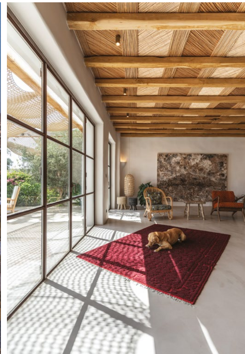
Villa La Bergerie