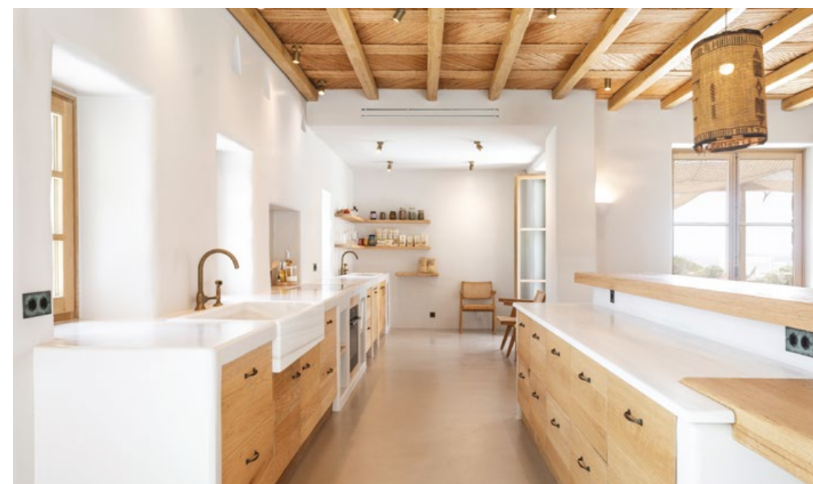
Villa La Bergerie

Αν έπρεπε να περιγράψουμε τη φιλοσοφία του γραφείου Mykonos Architects με λίγα λόγια, θα μιλούσαμε ξεκάθαρα για την αρμονική σύνδεση της κυκλαδίτικης παραδοσιακής αρχιτεκτονικής με τη λειτουργικότητα και τη σύγχρονη αισθητική αλλά και για την εμπειρία διαβίωσης, που κατά κανόνα πρέπει να είναι συναρπαστική.