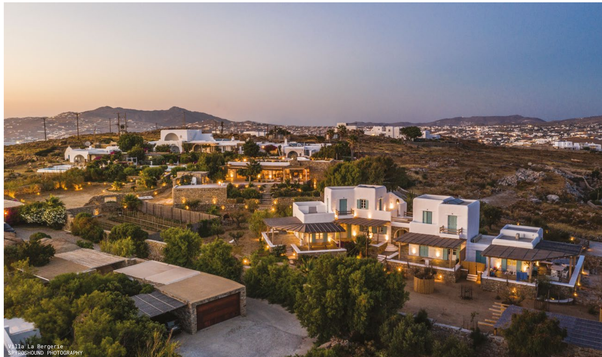
Villa La Bergerie